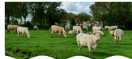
Boschlust - d'Aquitaine koeien